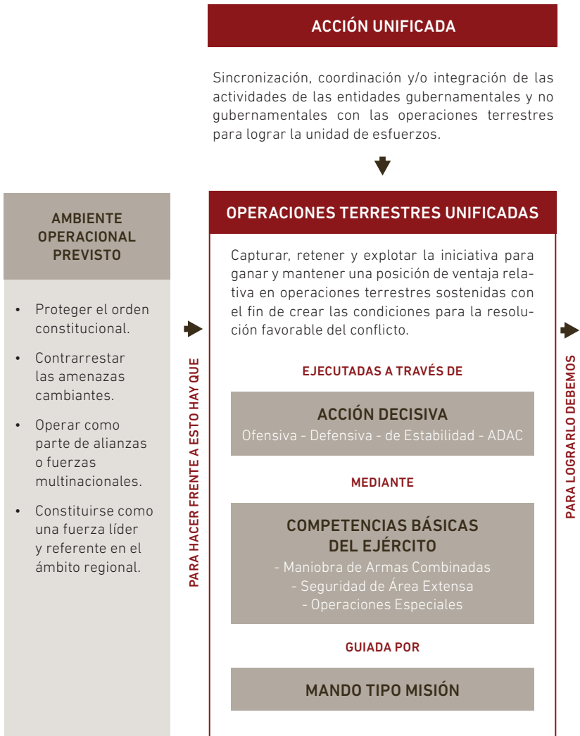
| Figura 1. | Operaciones Terrestres Unificadas.