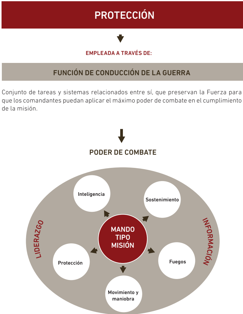
| Figura 1. | Función de Conducción de la Guerra "Protección".